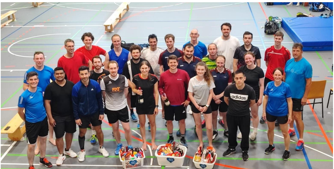
Gauditurnier zum 50jährigen Spartenjubiläum