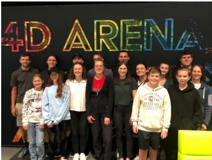
Vereinsausflug 2023 in die 4D-Arena in St. Englmar