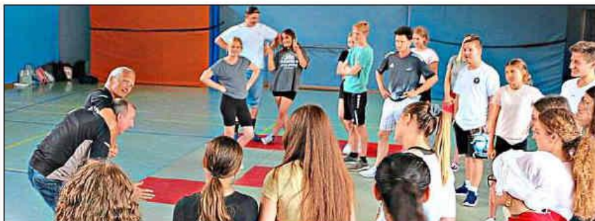
Selbstverteidigung in der Praxis – die lernen die FOS-Schüler bei den Ju-Jutsu-Trainern des TSV Regen kennen.

Verantwortung, soziale und emotionale Nähe sind in der Ausbildungsrichtung Sozialwesen wichtige Lerninhalte im Schulfach Pädagogik und Psychologie und auch im erweiternden Wahlfach Sozialpsychologie werden Kenntnisse zu „prosozialem Verhalten“ vertieft. – bb